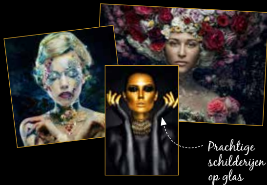
Prachtige schilderijen op glas