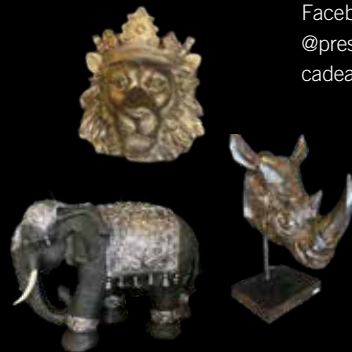
Steeds verrassende artikelen